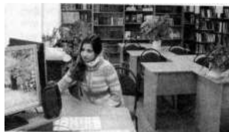
Современные технологии позволяют читателям в полной мере использовать ресурсы библиотечного фонда

В отделе формируют электронный, алфавитный и систематический каталоги, без которых невозможна работа библиотеки. Электронный каталог доступен не только читателям в стенах библиотеки, но и за её пределами – в режиме онлайн. Качественно новые возможности для работы открыла автоматизированная библиотечная программа «ИРБИС». Ведение электронного учёта, создание электронного каталога на фонды 14 муниципальных библиотек, включающего до 196 тысяч записей, формирование и печать карточек для каталогов, создание справочно-поискового аппарата на книги – всё это помогает читателям максимально эффективно использовать ресурсы универсального библиотечного фонда.