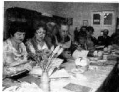
Заседания гостиной посещают люди разного возраста и разных профессий – инженеры, педагоги, врачи, экскурсоводы, пенсионеры...

Ни одно заседание не проходит без чтения стихов поэта. За чашкой чая гости иногда засиживаются допоздна. Вместе смотрят фильмы о поэте, обсуждают новинки есениноведения. Разговор часто выходит за рамки обозначенных тем, и это совершенно закономерно. Есенинская поэзия – живое слово, растворённое в сегодняшней жизни. И современность её звучания находит всё новых и новых поклонников.