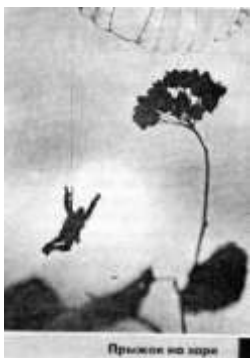
Прыжок на заре