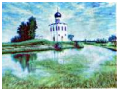
«Храм Покрова на Нерли»