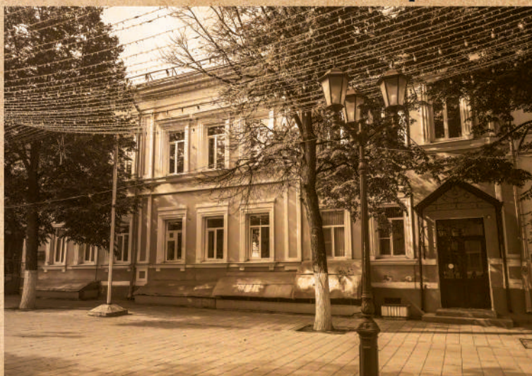
Ул. Почтовая, 52 (Подбельского)