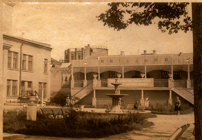
Клуб «Красное знамя»