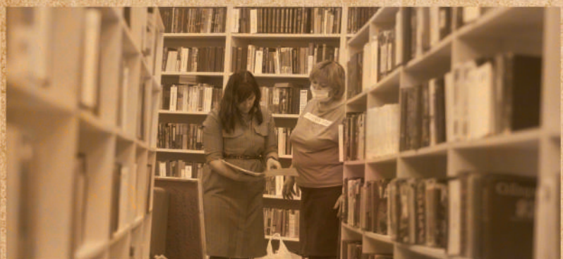
Адреса опыта: современные практики работы