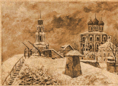
Пункт противовоздушной обороны на валу Рязанского кремля

Небо города прикрывает 269-й зенитный дивизион, почти полностью состоящий из девушек. Немецкие самолеты старались повредить железнодорожные пути, попасть в вокзал, в работавший на авиацию деревообрабатывающий завод. Прогрел взрыв в детском саду на улице профессора Кудрявцева, где погибло много детей. Одна бомба угодила в госпиталь на улице Каллева. Сброшенный с самолета фугас взорвался во дворе управления НКВД. Кроме того от бомб пострадал бывший дом Салтыкова-Щедрина. С 8 ноября 1941 г. в Рязани был введен комендантский час — с 22 до 7 часов. На случай вторжения противника всем рабочим батальонам, милиции и прочим службам было выдано предписание. В нем подробно рассказывалось, где прятаться в лесах, чтобы начать партизанскую борьбу. В эти же дни по льду Оки в сторону Солотчи выехали десятки автомобилей. В Шумашах с них перегружали на сани и развозили по лесным уголкам секретные грузы. Создавались тайные склады оружия и боеприпасов, запасы продовольствия, теплых вещей для партизан.