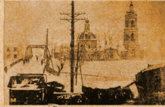
наступление под Рязанью

Войска Красной Армии перешли в контрнаступление. Переброска 10-й армии в район Рязани, Канина, Шилово началась 24 ноября. Она должна была развернуться в полосе Зарайск — Захарово — Пронск — Гремячка, на фронте протяженностью 110-115 км. Южнее у Скопина развертывалась также перебросенная из тыла 61-я армия, вошедшая в состав Юго-Западного фронта. 5 декабря штаб 10-й армии разместили в Старожилове. С 1 по 5 декабря на территории области стали разгружаться соединения 10-й армии. Согласно директиве командования Западного фронта, они должны были нанести удар в направлении Михайлова, а затем к 10 декабря овладеть расположенными на территории Тульской области Сталингорском (Новомосковском) и станцией Узловая. Но еще ранее на территории Рязанской области, на южном фланге битвы за Москву, советские войска добились одного из первых успехов, освободив 29 ноября 1941 г. город Скопин.