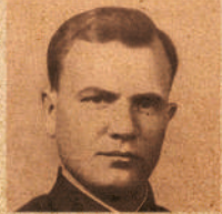
Портрет В.А. Молодцова

В Одессе погиб командир разведывательно-диверсионного отряда Владимир Александрович Молодцов. Под его командованием в ноябре 1941 г. партизаны подорвали так называемый «специальный поезд». Было уничтожено около 250 офицеров и солдат румынских оккупантов. Перед расстрелом герой отказался просить о помиловании: «— Я русский, и на своей земле просить пощады у врага не собираюсь!»