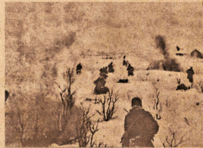
ПОДГОТОВКА К ОБОРОНЕ

Во второй половине ноября немецко-фашистские войска наступали на Москву. Вторая танковая армия, которой командовал лучший танковый генерал вермахта Гудериан, нанесла удар в обход Тулы. Правый фланг наступавшей группировки врага продвигался в направлении Зарайска, Рязани, Ряжска. 24 ноября был захвачен Михайлов, 25 ноября — Захарово, а через несколько дней — Скопин. В Рязани еще 8 ноября ввели комендантский час, а 27 ноября — осадное положение. Жители города готовились к худшему.