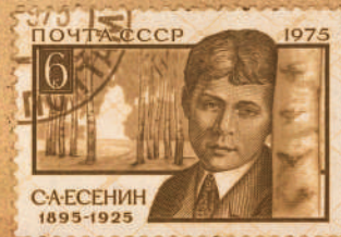
Почтовая марка «80 лет со дня рождения С.А. Есенина (1895-1925)»

Любовь — это купание, нужно либо нырять с головой, либо вообще не лезть в воду. Если будешь слоняться вдоль берега по колено в воде, то тебя только обрызгает брызгами ты будешь мёрзнуть и злиться.