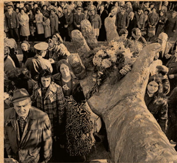
Открытие памятника Есенину, 1975 г.