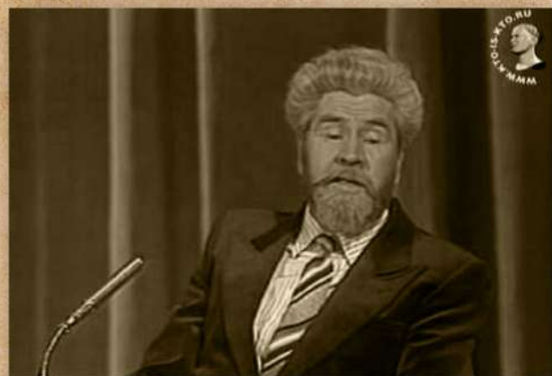
Встреча писателя Б.А.Можаяева с читателями