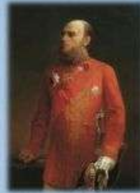
Колесов А. М. «Портрет П. П. Семенова-Тян-Шанского», 1874 год.