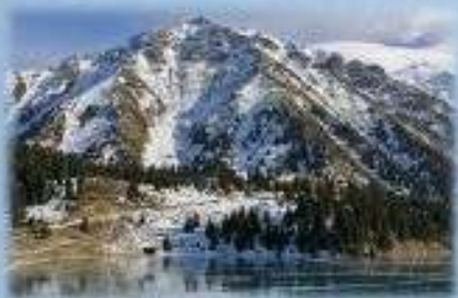
Зайлиийский Алатау: горный хребет на северо-западе Тянь-Шаня (на границе Казахстана и Киргизии).

В 1856 году было получено согласие Географического общества на снаряжение экспедиции в Среднюю Азию, и в начале мая Семенов отправился в путь.