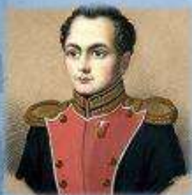
Семенов Петр Николаевич (1791—1832)