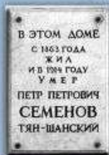
Мраморная памятная доска в Санкт-Петербурге

1863-26.02.1914 года — дом А.П. Заболоцкого-Десятовского — 8-я линия, 39. В 1930-х годах квартира Семёновых-Тян- Шанских была разделена на две: № 2 и № 5. После капитального ремонта здания в 1964— 1965 годах квартира № 5 была вновь поделена. Квартира № 2 сохранила свою планировку.