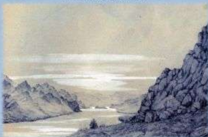
Рисунок П. Кошарова из альбома к путешествию на Тянь-Шань, 1857 год