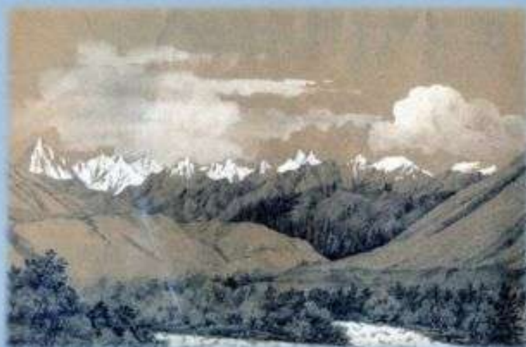
Рисунок П. Кошарова из альбома к путешествию на Тянь-Шань, 1857 год