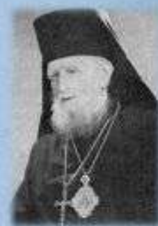
Епископ Александр (в миру Александр Дмитриевич Семенов-Тян-Шанский)