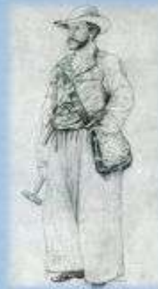
Петр Петрович Семенов-Тян-Шанский.

Тщательно и всесторонне готовился Семенов к путешествию в Тянь-Шань. В 1853 и 1854 годах он посетил Алтай и совершал там в горах многочисленные экскурсии пешком, без проводника, с колтасом, занимаясь геологическими и ботаническими исследованиями. Побывал и на Везувии, совершив на него около двух десятков восхождений. Собирая сведения о Тянь-Шане, Семенов изучил все источники, в которых содержались упоминания о географии этой горной страны.