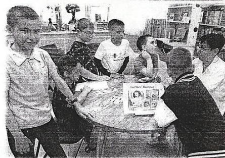
Пушкинский день в «Есенинке»

В 2024 г. в библиотеке прошли более 30 мероприятий, посвящённых «солнцу русской поэзии», любимому поэту Сергею Есенину.