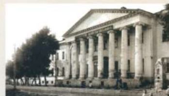
Губернская земская больница Адрес: ул. Семинарская, 46

Сергей Есенин неоднократно бывал в посёлке Солотча и на территории современного Солотчинского женского монастыря в 1912-1913 годах, совершая путь по узкоколейной железной дороге.