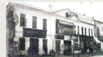
Электрический театр «Дарьялы» Адрес: ул. Почтовая, 63

26 сентября 2014 года установлена мемориальная доска: «В этом здании бывшего Калининского товарищества, где в период Первой мировой войны размещалось Рязанское уездное по воинской повинности присутствие, в мае 1915 года призывался на военную службу великий русский поэт Сергей Есенин»