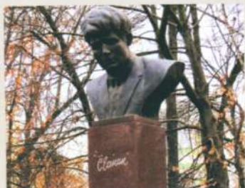
Бюст С. А. Есенина