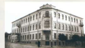
Рязанская губернская чрезвычайная комиссия Адрес: ул. Ленина (Астраханская), 46

28 декабря 2005 года установлена мемориальная доска: «В этом здании с 1912 по 1917 гг. находился электрический театр «Дарьялы», который летом 1917 года посетил великий русский поэт Сергей Александрович Есенин»