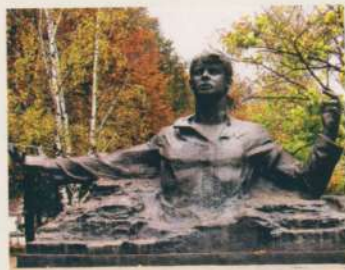
Памятник С. А. Есенину