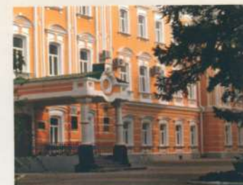
Рязанский государственный университет имени С. А. Есенина. Главный корпус