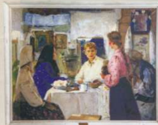
Рязанский государственный областной художественный музей имени И. П. Пожалостина

В библиотеке хранится самый крупный в регионе доступный фонд есенинианы. В электронной библиотеке представлены прижизненные и посмертные издания Есенина.