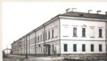
Типография и редакция газеты «Рязанские губернские ведомости» Адрес: пл. Соборная, 21

28 декабря 2005 года установлена мемориальная доска: «Здесь до революции размещались типография и редакция газеты «Рязанские губернские ведомости», где летом 1912 года бывал великий русский поэт Сергей Александрович Есенин с целью публикации своего первого стихотворного сборника «Больные думы»