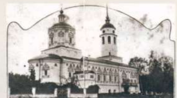
Солотча и Солотчинский женский монастырь Рождества Богородицы Адрес: посёлок Солотча, пл. Монастырская, 1А

28 декабря 2005 года установлена мемориальная доска: «Здесь до революции размещались типография и редакция газеты «Рязанские губернские ведомости», где летом 1912 года бывал великий русский поэт Сергей Александрович Есенин с целью публикации своего первого стихотворного сборника «Больные думы»