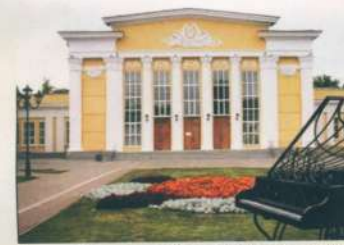
Рязанская филармония «Театр имени Сергея Есенина»

2 октября 2010 года на доме № 1/70 установлена мемориальная доска: «Улица Есенина (бывшая Рязжская) с 19 июня 1965 года носит имя великого русского поэта, уроженца Рязанской земли Сергея Александровича Есенина». Автор - Заслуженный художник РФ А. С. Анисимов.