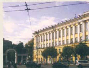
Улица Есенина. Есенинский бульвар

Перемещен из села Константиново, установлен 1 ноября 1995 года. Авторы: заслуженный художник РСФСР, скульптор А. П. Усаченко, почётный архитектор России Н. Н. Истомин.