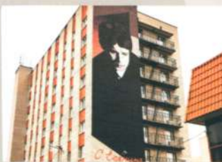
Театр Рязанского государственного университета имени С. А. Есенина «Переход»

М Школа № 69 Адрес: ул. Интернациональная, 27 Школьный музей С. А. Есенина. Открыт 22 декабря 2006 года.