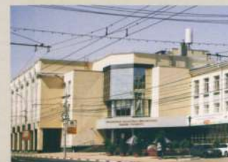
Рязанская областная универсальная научная библиотека имени Горького