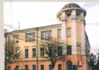
Рязанский музей путешественников