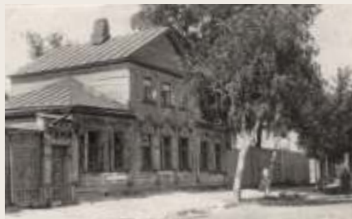
Дом Павловых Адрес: ул. Никольская, 19 (ныне Павлова, 25) В этом доме 14 (27) сентября 1849 года родился Иван Петрович Павлов. «Домик-крошка с мезонином в три окошка», - так ласково ученый называл свой отчий дом в Рязани. Здесь прошли его детские и юношеские годы.