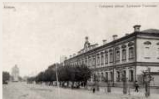
Рязанское духовное училище Адрес: город Рязань, ул. Соборная, 7 С 1860 по 1864 год Иван Павлов учился в духовном училище, в которое поступил в возрасте одиннадцати лет. Среди учащихся выделялся благодаря своей «...начитанности, хорошему изложению мыслей и критическому отношению к прочитанному».