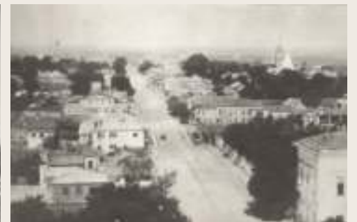
Улица Семинарская Одна из главных городских улиц прошлых столетий. Здесь располагались: Редутный дом, Губернская земская больница, Дом трудолюбия, деревянные жилые дома, украшавшие город. По Семинарской улице Иван Павлов ходил в Духовное училище, а затем и в Духовную семинарию.