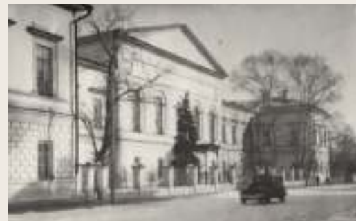
Рязанская духовная семинария Адрес: ул. Семинарская, 20 «Среднее образование получил в местной духовной семинарии. Вспоминаю ее с благодарностью», - писал Иван Павлов. В ней с 1864 по 1869 год учился будущий физиолог. В последний раз И.П. Павлов был в этом здании 19 августа 1935 года. Сейчас это музей истории воздушно-десантных войск.